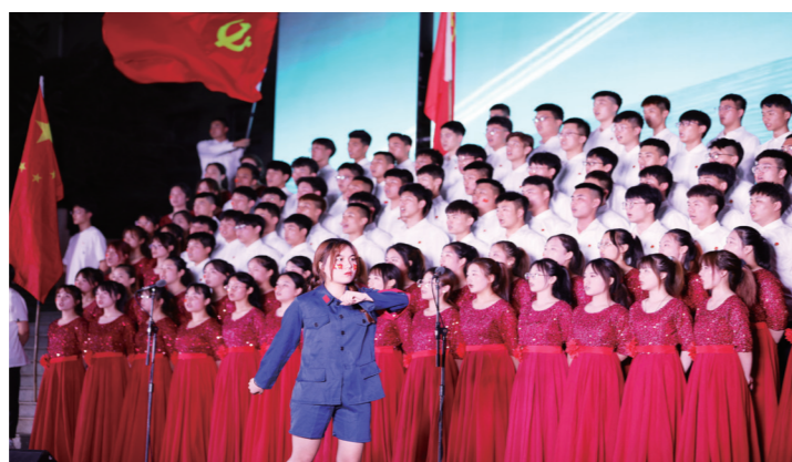
学院开展“青春颂歌献给党 庆祝建党100周年”大型合唱比赛

高校基层党支部要提高政治站位,从“为国育人,为党育才”的高度,教育学生深入了解中华历史,教育青年学生从党的奋斗史、发展史、辉煌史中汲取智慧和力量,不断提升党史学习教育效果。