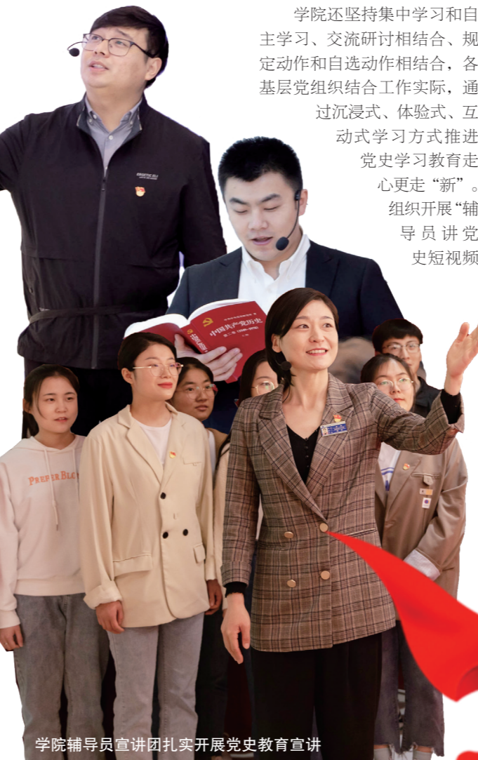
学院辅导员宣讲团扎实开展党史教育宣讲

学院还坚持集中学习和自主学习、交流研讨相结合,规定动作和自选动作相结合,各基层党组织结合工作实际,通过沉浸式、体验式、互动式学习方式推进党史学习教育走心更走“新”。组织开展“辅导员讲党史短视频