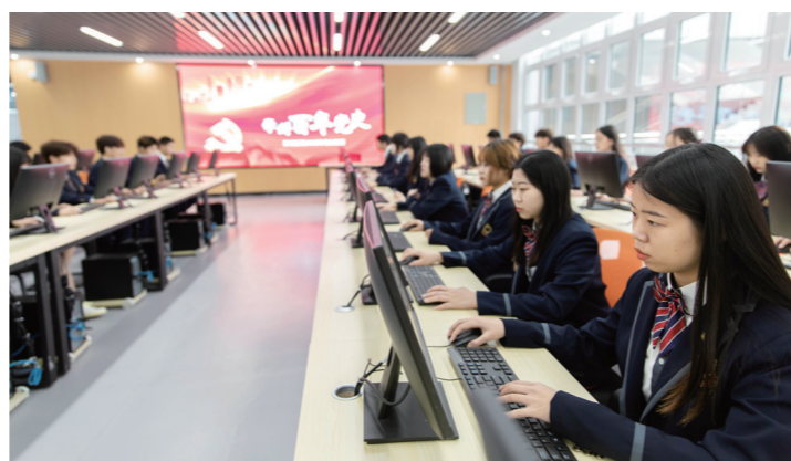
全体党员共答100道党史题