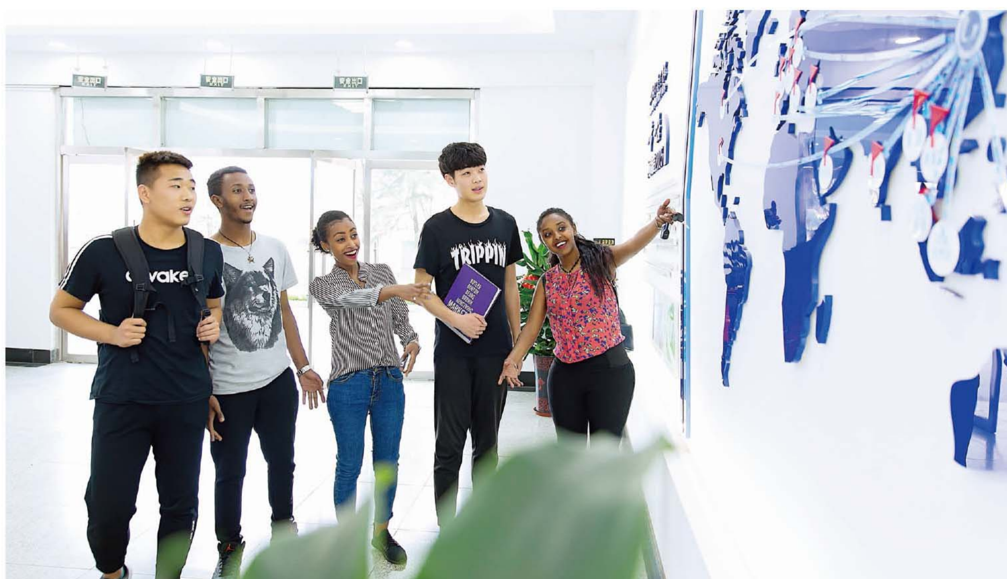
中外学生一起学习交流

今年4月,山东理工职业学院澳大利亚分校正式成立。澳大利亚分校将开设航空服务、航空维修、无人机应用技术及商科类专业,面