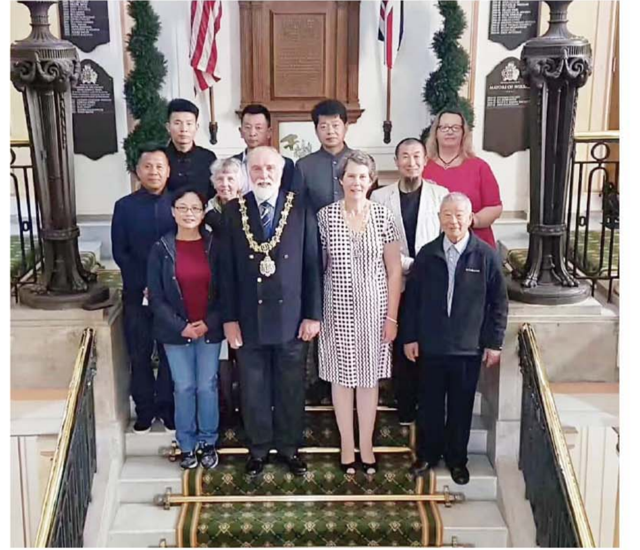
▲文化节部分嘉宾与利物浦市长合影