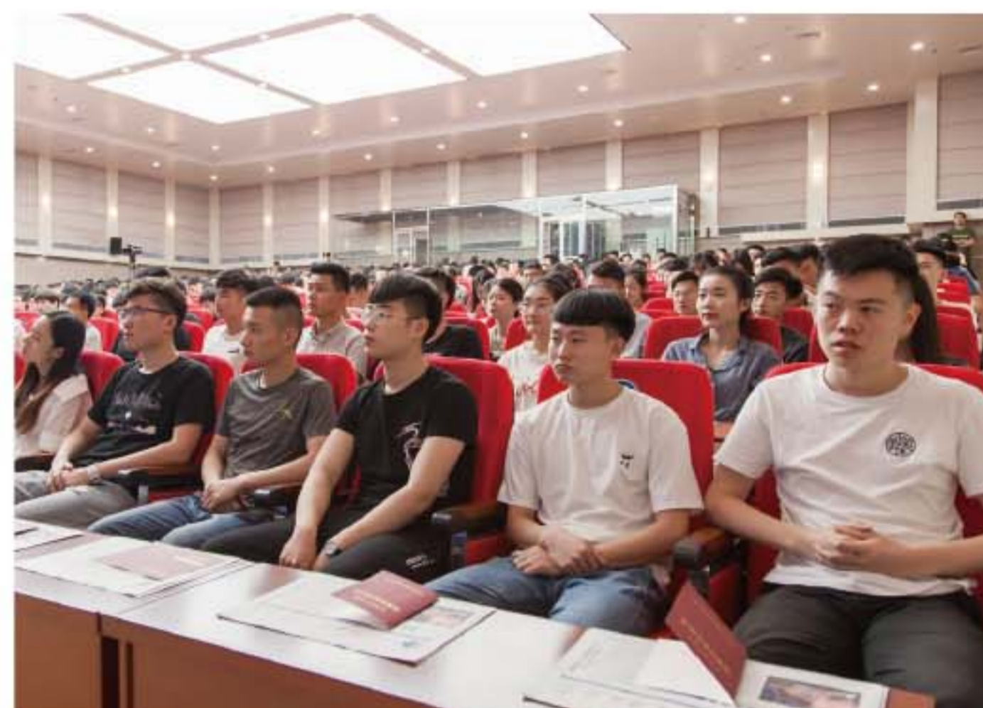
2018级毕业生专注听“课”

得了国家级奖学金,41名同学获得省级奖学金,881名同学获得了学校奖学金,还有153名同学通过专升本考试被本科大学录取,有8名同学考取攻读硕士学位,有25名同学赴韩国、澳大利亚留学读本科和硕士学位。59名同学在全国技能大赛、省级技能大赛中获奖20项。这