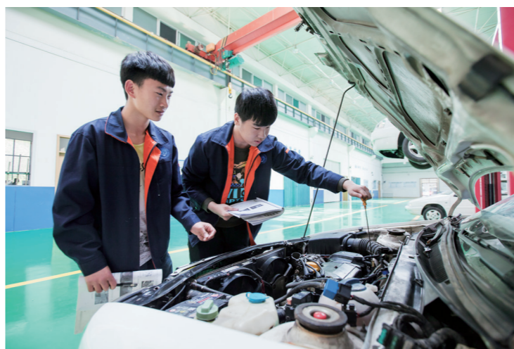
“1234”人才培养模式培养出大批人才

建设全国师资培训基地。2013 年—2019 年，学院连续 7 年承办了中德诺浩全国师资培训，共为全国 265 所职业院校培养了 1300 余名汽车专业骨干教师。2018 年培训基地被确定为优质省级职业院校教师培训基地。2020 年 8 月 24 日至 9 月 25 日，培训评价组织中德诺浩公司与学院齐心协力，克服疫情影响，共