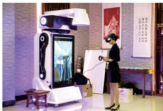
特情处置VR模拟操作考核现场