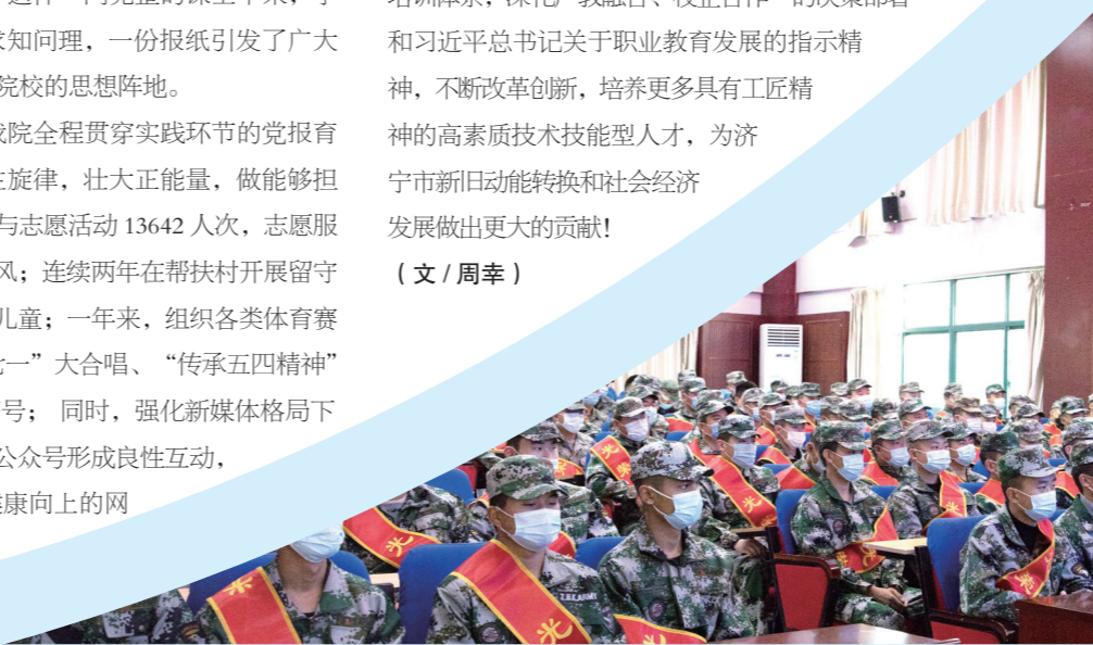
177名2020年退役的军人在我院开始为期三个月的技能培训

实践基地,学院牵头成立“生产及服务型劳动联盟”;以学院非物质文化遗产传承教育基地为载体,打造文化与劳动深度结合实践品牌……“硬指标”在我院落地开花,深耕实践出真知,用专业技能擦亮劳动育人底色。