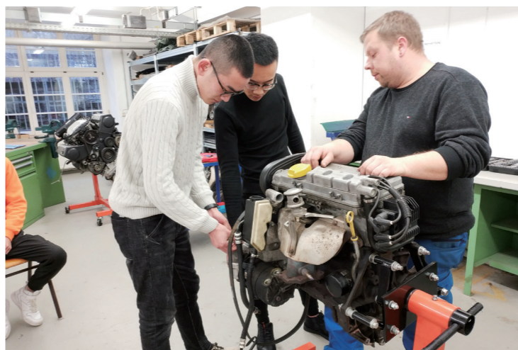
深化内部机制创新，打造职教创新发展高地院校

我院认真贯彻落实《教育部 山东省人民政府关于整省推进提质培优建设职业教育创新发展高地的意见》（鲁政发〔2020〕3 号）等文件精神，围绕立德树人根本任务，全面提升学院综合办学实力和人才培养水平，实现高质量创新发展。建成一批支撑和引领新技术、新产业、新业态发展的特色高水平专业群和技术技能创新服务平台，建成高素质、复合型、创新型技术技能人才培养培训高地、科技成果转化高地，打造职教创新发展高地院校。