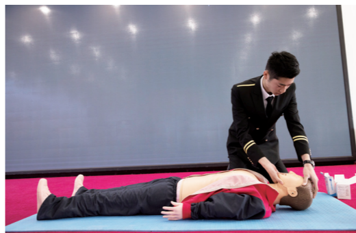
机上急救考核现场