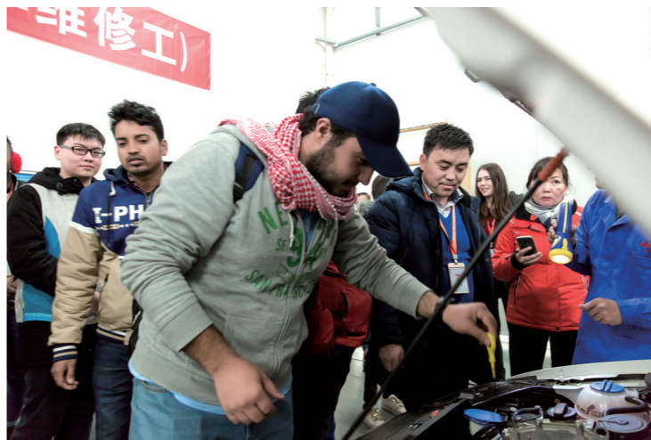
依托国际学生孔子文化节，举办“一带一路”职业教育培训班

构建职业教育国际交流合作平台。充分发挥地处“孔孟之乡”、儒家文化发源地的优势，提升“来华留学生孔子文化节”层次，将其纳入“中国曲阜国际孔子文化节”。通过促进中外文化交流，助力我国与“一带一路”沿线国家民心相通，推动中外教育交流合作，构建“一带一路”教育共同体，创新“孔子六艺学堂”职教新模式，涵盖孔孟故里研学、中华文化体验、职业技能实训、中外院校学术交流、国际教育论坛等活动。与科研院所、企业、行业合作开展职业教育国际交流研究，建设山东理工职业教育研究高端智库打造职业教育国际化办学“山东高地、理工品牌”。