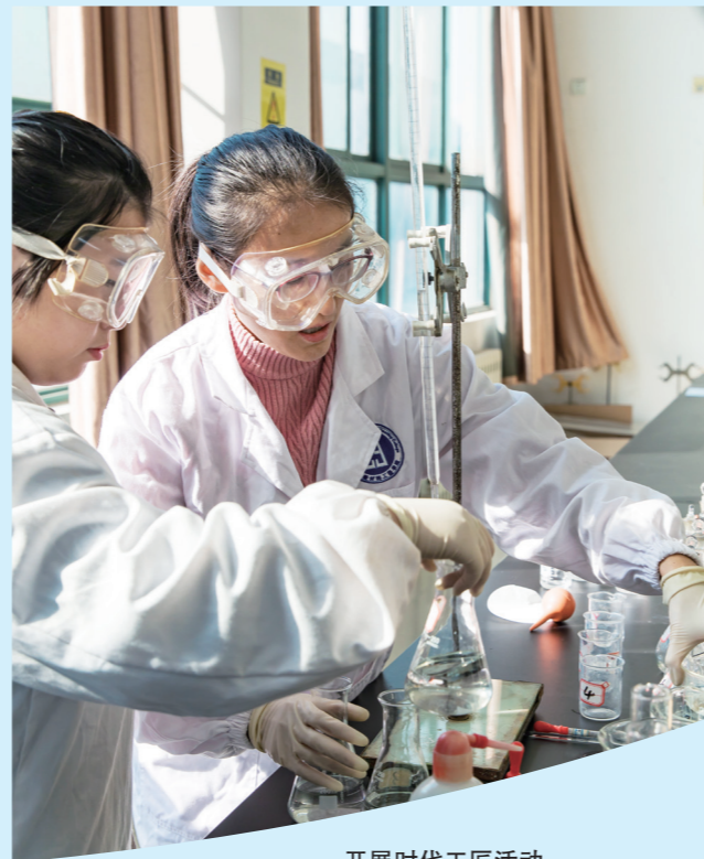
开展时代工匠活动