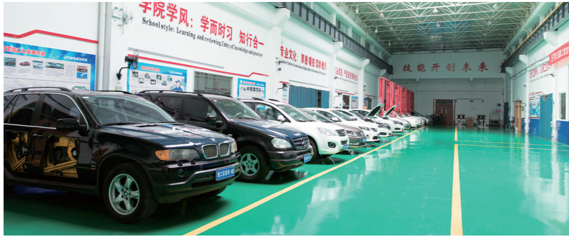
先进的汽车实训室供学生实践使用

2020年1月，首个部省共建国家职业教育创新发展高地在山东正式启动。这是贯彻落实国务院“职教20条”的重要举措，翻开了部省合作推进整省提质培优发展职业教育的新篇章，为全国职业教育改革提供“山东样本”，贡献山东力量。我院抓住这一重大历史机遇，站在风口，顺势而为，乘势而上。对接山东新旧动能转换“十强”产业、济宁市“1+5+N”产业布局，立足济宁、服务山东、面向全国，以提高质量为核心，以产教融合为主线，以专业群建设为龙头，以体制机制创新为动力，培养创新型、发展型、复合型高素质技术技能人才，推进科技创新资源与产业融合，持续提升我院服务国家战略和区域发展的能力、水平和贡献度。