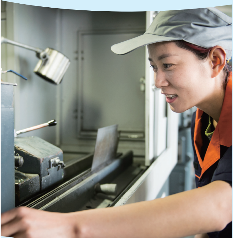
培养未来的“大国工匠”

以三全育人为引领,探索高职院校劳动教育实践。通过实施“六个一”劳动技能培养工程,让每一个学生完成生活劳动、生产劳动、服务型劳动、文化内涵劳动等学习和实践;构建高职特色劳动教育课程体系,实现课程内容系统化,课程实施渠道要综合化,课程实施形式深化,课程形态整合化,课程评价作品化;打造一批实习和劳动