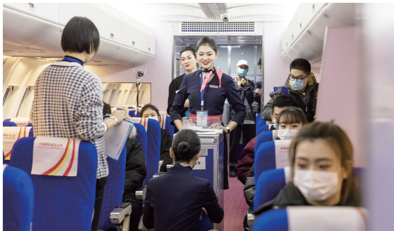
客舱服务考核现场