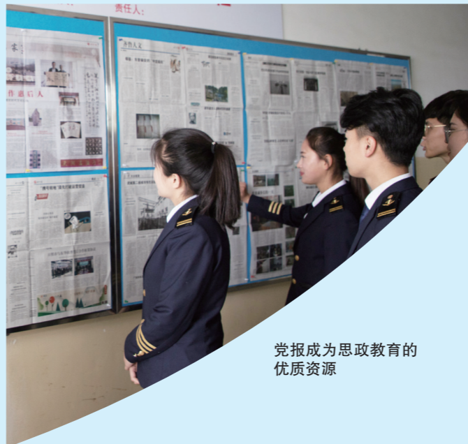
党报成为思政教育的优质资源