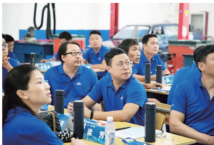
我院连续 7 年承办中德诺浩全国“双师型”教师资格培训

导委员会、联合办公室等，制定办学章程，明确合作双方职责，建立健全管理机制和运行机制。建立“能进能出、能上能下”的灵活用人机制，建立起协议工资、项目工资、年薪制、兼职取酬等方式相结合的灵活薪酬分配方式，充分调动教职工和管理队伍的积极性。双方共同创新人才培养模式，开展专业建设、课程开发、双师队伍建设，共建实训基地，开展培训项目、科研技术服务，举办技能大赛，校企协同创新，开展面向产业的管理和人才咨询服务等，建设中国特色、世界水平的汽车产业相关专业群，将学院建设成为引领混合所有制办学改革、具有辐射作用的高水平创新型产教融合基地、全国骨干教师培训基地、1+X 职业技能等级证书培训认证示范基地，全国知名企业人才培养和输送基地；为汽车产业领域培养具有国际视野、先进服务理念和各项专门技能的中高级管理人才及各类技术技能人才。