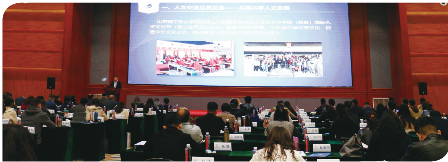
我院代表山东省作典型报告

11月4日,由教育部国际合作与交流司主办的首期中外人文交流区域主题研修班开课,受山东省教育厅推荐,我院代表山东省作《发挥东方圣城世界文化遗产优势 举办国际学生孔子文化节,建设中外人文交流高地》的典型报告,以我院举办的国际学生孔子文化节为切入点,介绍了该院在中外人文交流方面所作的贡献与成绩。我院发挥职教自信,在本次研修班上传播职教声音,提出山东方案,贡献山理智慧。