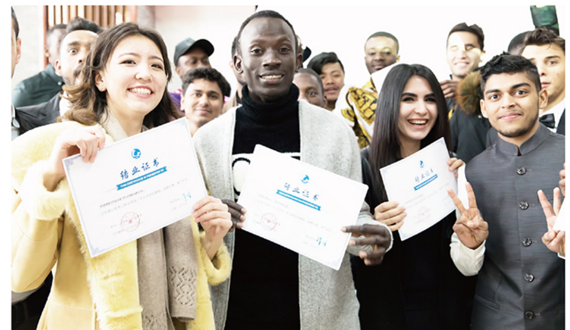
首批留学生顺利结业。