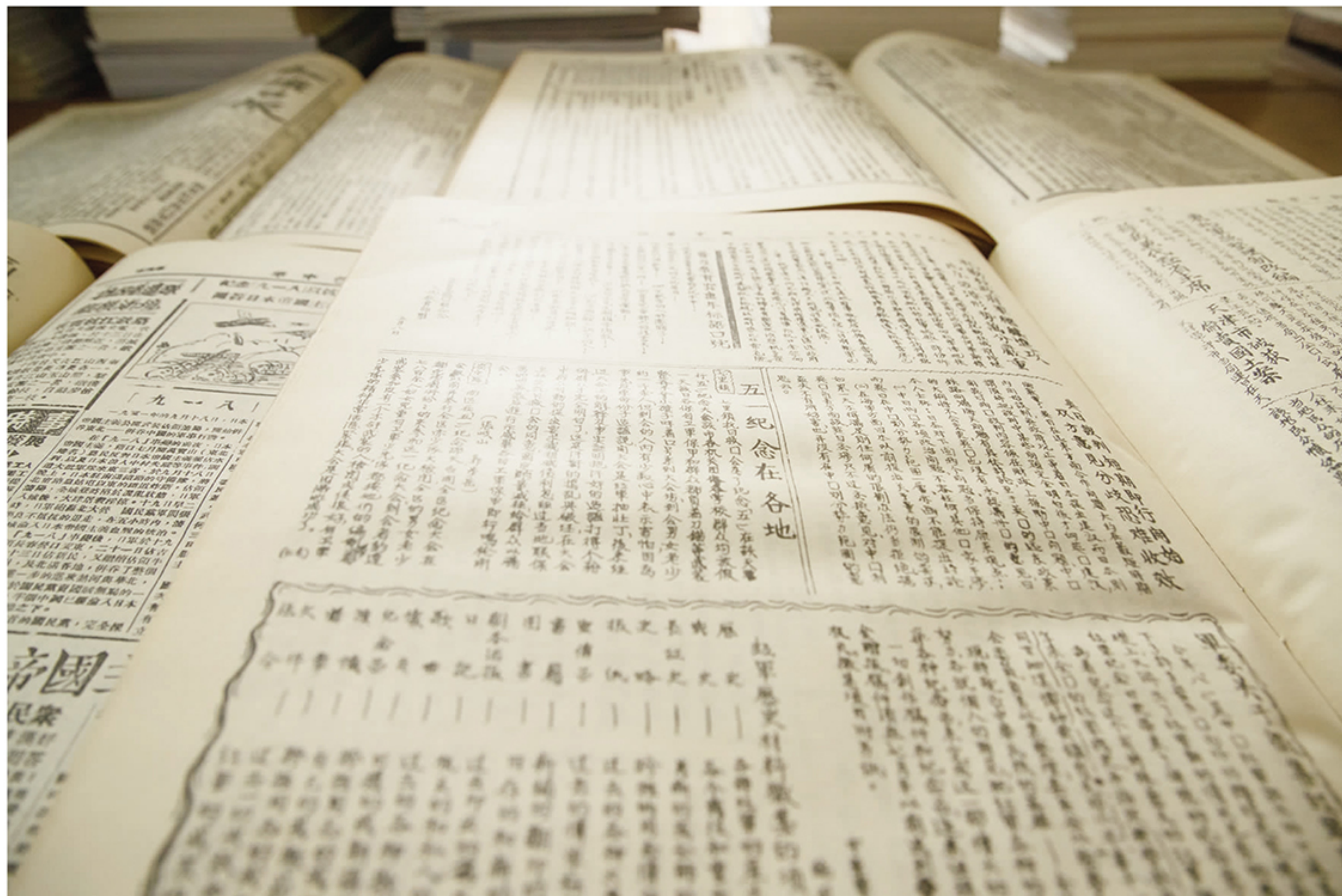
馆藏1930年的《红旗日报》

图书馆典藏云集,走近书架,斑斓的封面是知识殿堂的大门;走近图书,阵阵的墨香是知识殿堂的华灯;走进文字,华美的文采是知识殿堂的钥匙。当电视、网络信息还没有被开发的年代,书便是领先一步的大众传媒。高尔基曾经说过:“书籍是人类进步的阶梯”。莎士比亚也说过:“书籍是全世界的营养品”。在我院60余年的办学历史中,图书馆见证了一代代学子在书海里徜徉。无论是世人瞩目的名著,清新似水的散文,还是富有哲理的中外诗篇,读者在满室的书香中享受心灵的安逸。在这里,没有喧闹的声音,只有轻轻的翻书声。只要你来到这里,总会有所收获。