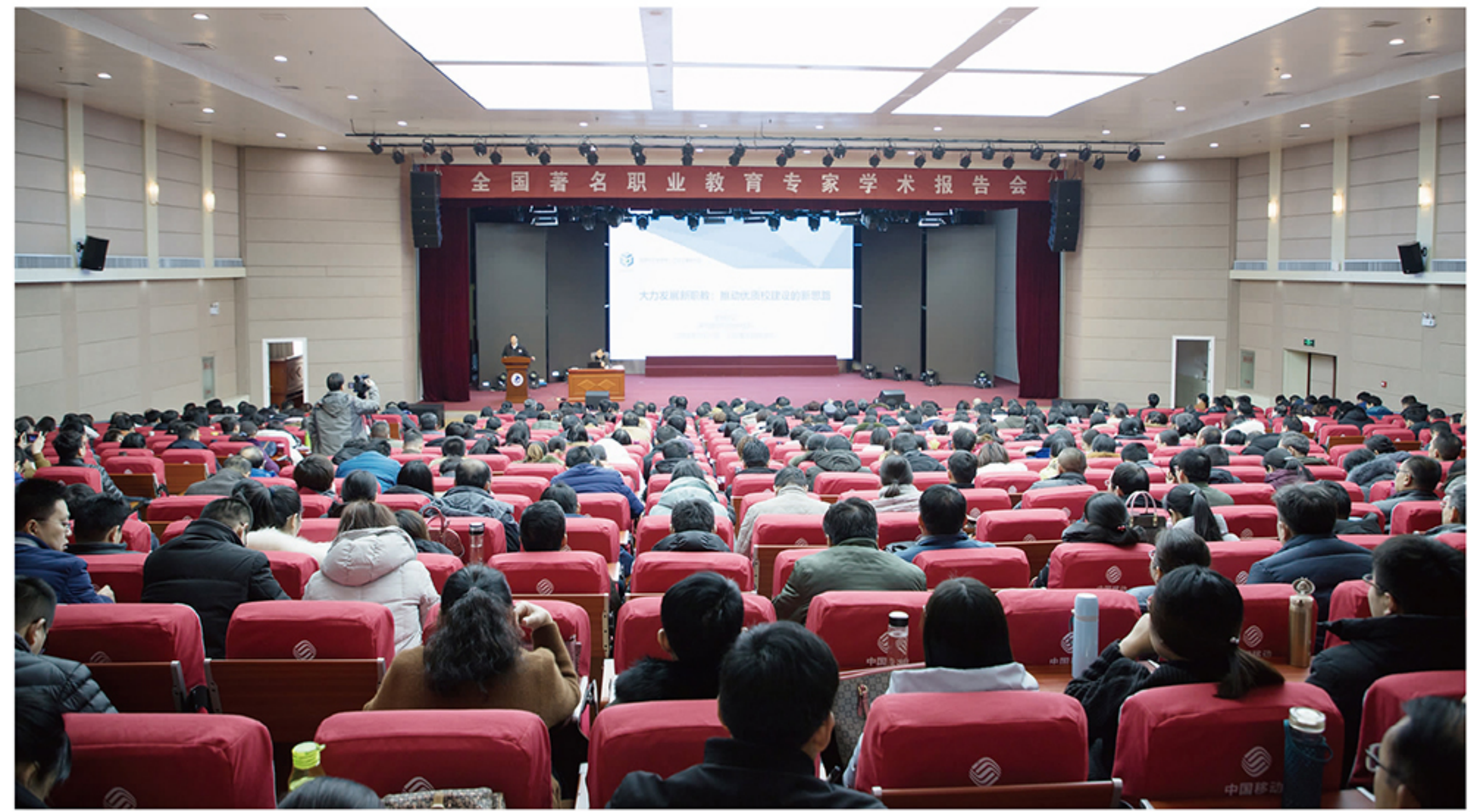
全体教职工聆听了专家的讲座

“改革开放40年,我国已成为名副其实的职业教育大国,但不是职业教育强国。职业教育强国要求职业教育为本国的经济社会发展,尤其是实体经济发展提供强有力的技术与人才支撑,做出很大的贡献。”金志涛教授提到,当前职业教育仍带有浓厚的“世界工厂”的痕迹,高职院校的发展需要适应新时代的新理念、新战略和新要求,通过优质校建设来引领改革。他综合了《高等职业教育创新发展行动计划(2015-2018年)》和山东省优质高等职业院校建设工程的要求总结出优质校的十大建设内容,并因地制宜地为我院创建优质校提供了宝贵的见解。