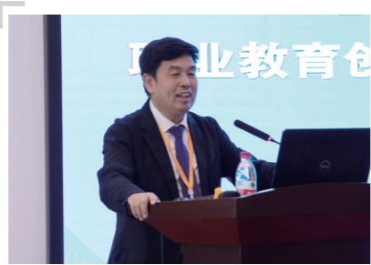
山东省教育厅总督学 邢顺峰

山东理工职业学院依托儒家圣地,举办以人文体验交流和技术技能培训为主要内容的文化节,是推动教育领域中外人文交流的具体举措,是顺应中外人文交流发展趋势的主动作为。学校举办中外师生参加的文化节,有利于在中外合作的更大平台上促进教育资源交流共享,以更加宽广的视野参与教育对外开放,满足学校在新时代追求高质量发展的需求。