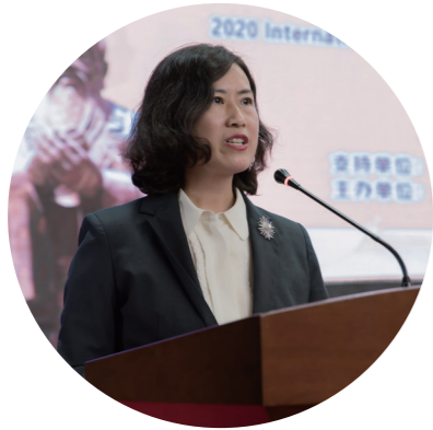
教育部中外人文交流中心副主任 夏娟

山东理工职业学院依托儒家圣地,举办以人文体验交流和技术技能培训为主要内容的文化节,是推动教育领域中外人文交流的具体举措,是顺应中外人文交流发展趋势的主动作为,有利于在中外合作的更大平台上促进教育资源交流共享,以更加宽广的视野参与教育对外开放,满足学校在新时代追求高质量发展的需求。