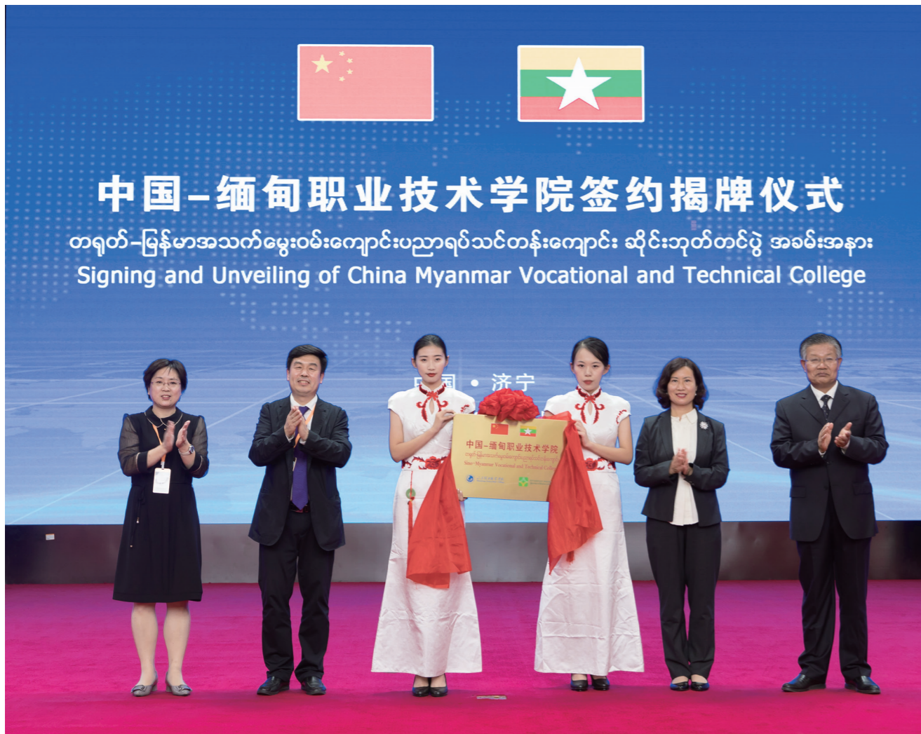
领导们为中缅职业技术学院揭牌