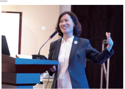
教育部中外人文交流中心副主任 夏娟

山东理工职业学院依托儒家圣地,举办以人文体验交流和技术技能培训为主要内容的文化节,是推动教育领域中外人文交流的具体举措,是顺应中外人文交流发展趋势的主动作为。学校举办中外师生参加的文化节,有利于在中外合作的更大平台上促进教育资源交流共享,以更加宽广的视野参与教育对外开放,满足学校在新时代追求高质量发展的需求。