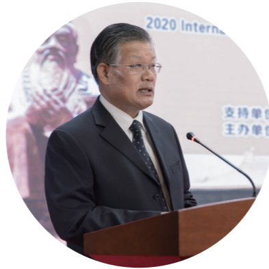
济宁市人大常委会副主任、总工会主席 张玉华

山东理工职业学院组织举办“国际学生孔子文化节”,是落实省教育厅等10部门《关于支持新时代职业教育对外开放的意见》的生动实践,打造了一个充满活力的中外文化和职业教育交流新平台,意义重大。希望“国际学生孔子文化节”办成在全省乃至全国具有影响力的齐鲁文化品牌和教育品牌。