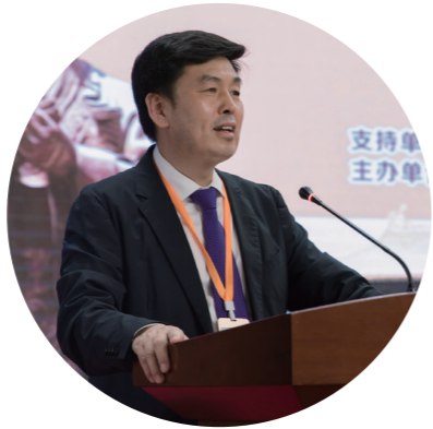
山东省教育厅总督查 邢顺峰

山东理工职业学院依托儒家圣地,举办以人文体验交流和技术技能培训为主要内容的文化节,是推动教育领域中外人文交流的具体举措,是顺应中外人文交流发展趋势的主动作为,有利于在中外合作的更大平台上促进教育资源交流共享,以更加宽广的视野参与教育对外开放,满足学校在新时代追求高质量发展的需求。