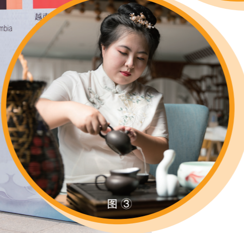
图1：与来自26个国家的国际学生进行云端互动 图2：与几内亚学生互动 图3：我院学生向国际学生展示茶艺 图4：我院学生向国际学生表演二胡