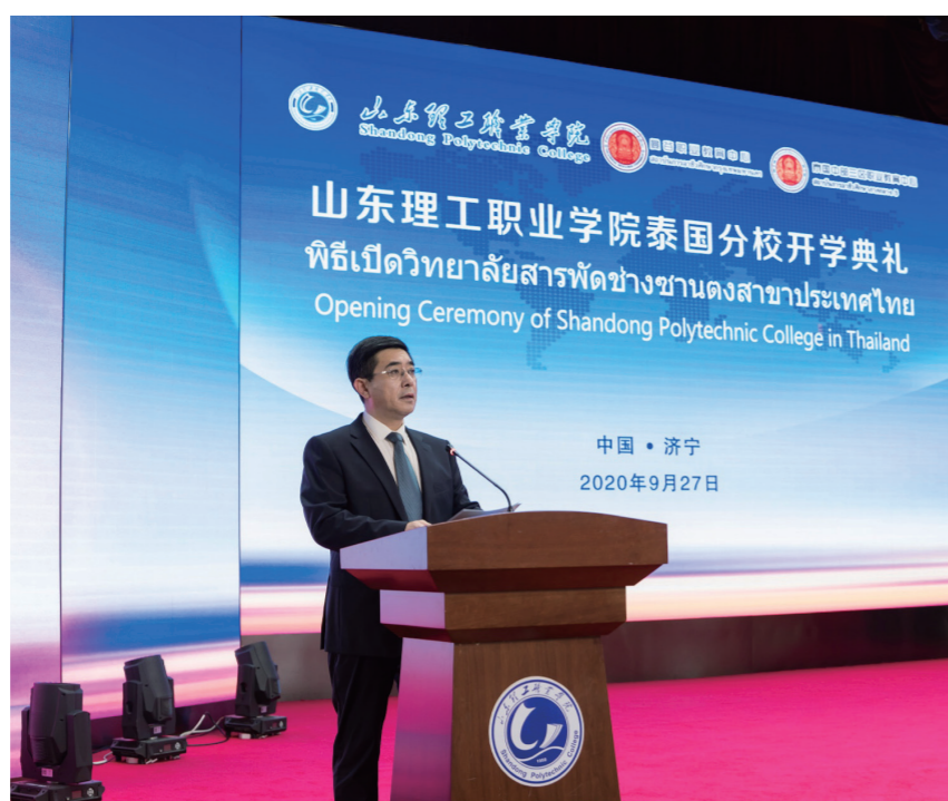
山东理工职业学院泰国分校开学典礼现场

“泰国积极响应中国‘一带一路’倡议，正在推动‘东部经济走廊建设计划’和‘泰国 4.0 计划’，泰国教育界和产业界都迫切希望能够培养大量懂汉语的高素质国际化人才，希望通过与山东理工职业学院的合作促进泰国职业教育发展和人才培养。山东理工职业学院泰国分校为泰国学生学习中国文化及先进专业技术知识搭建了桥梁。”泰国教育部