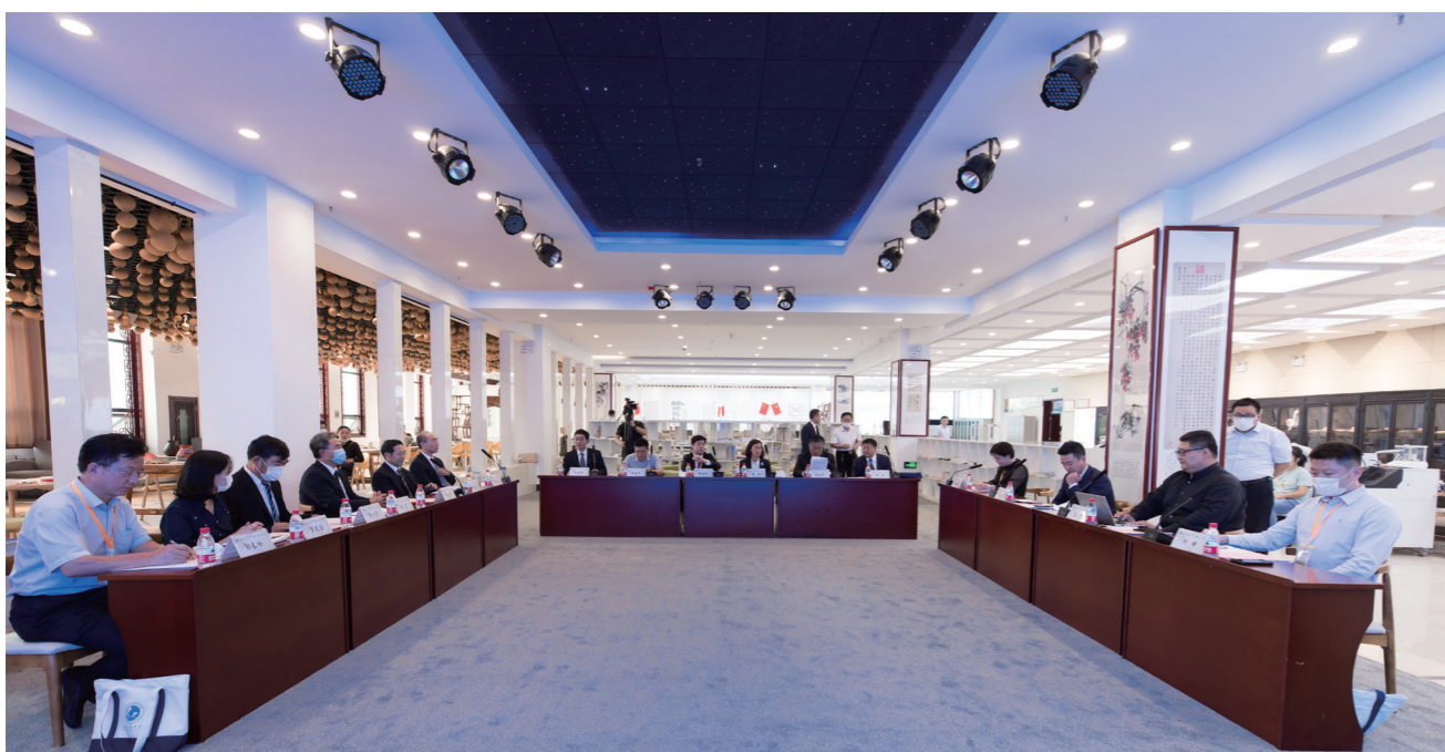
来宾共话职业教育创新发展高地建设