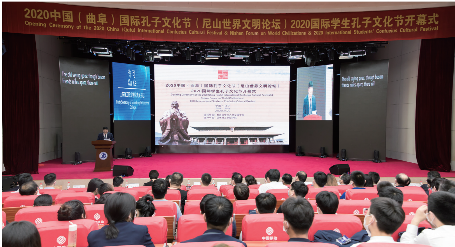
开幕式现场

9月27日,2020国际学生孔子文化节在我院隆重开幕,该活动纳入了2020中国(曲阜)国际孔子文化节(尼山世界文明论坛),由山东理工职业学院主办,教育部中外人文交流中心指导。今年文化节的主题为“文化交流互鉴,共享‘一带一路’”,采用线上线下相结合、线上为主的方式进行,吸引了来自俄罗斯、德国、韩国、泰国、缅甸等10个国家教育主管部门和高校院校长,以及26个国家550余名国际学生,开展“云端交流”。