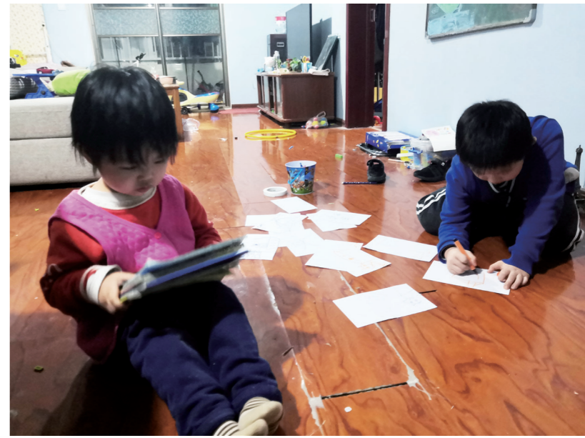
每天与两只“小神兽”在斗智斗勇中度过

春来了,万物生长,一切都会过去的!等那一墙花开,等那万物归来,世间美好依旧!愿这场疫情早日结束!愿山河无恙、百姓安康!