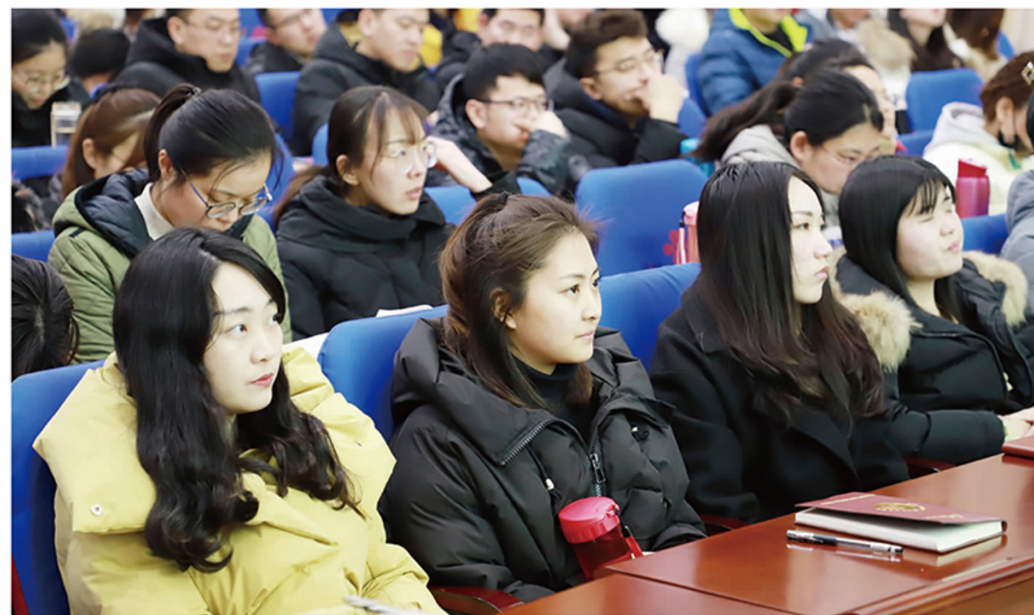
青年教师们认真聆听授课内容

田玉伟教授结合学院学生管理工作的实际情况,从6个方面介绍了如何做好辅导员工作;学生处处长王刚从辅导员的岗位职责入手,解读相关文件,并为青年辅导员如何管理学生支招。 对于刚入职的青年教师来说,几乎大部分是科研“小白”,在此次培训中,科研处处长王振海向青年教师们传授了如何做科研的宝贵经验,甚至细化到如何选题、立项等细节。这让青年教师明白搞科研,不仅仅是教师个人职业发展的必然追求,更是让学院强大的基石,对于高职教师来说,不仅要做一名会教书育人的老师,还要成为一名能做好科研工作研究者。 三天高强度的集中培训含金量很高,青年教师们犹如醍醐灌顶,对于一些刚入职不久的青年教师来说,或许对“高职教育”、“优质校”、“双师型”教师等概念都是模糊的,通过此次培训不仅加强了理论知识的学习,学习到了前辈们的教学、管理经验,还明确了将来的发展方向,而且能够帮助他们尽快成长起来投身于学院的“优质校”、“特高校”建设中来,推动学院进入高质量发展的快车道。