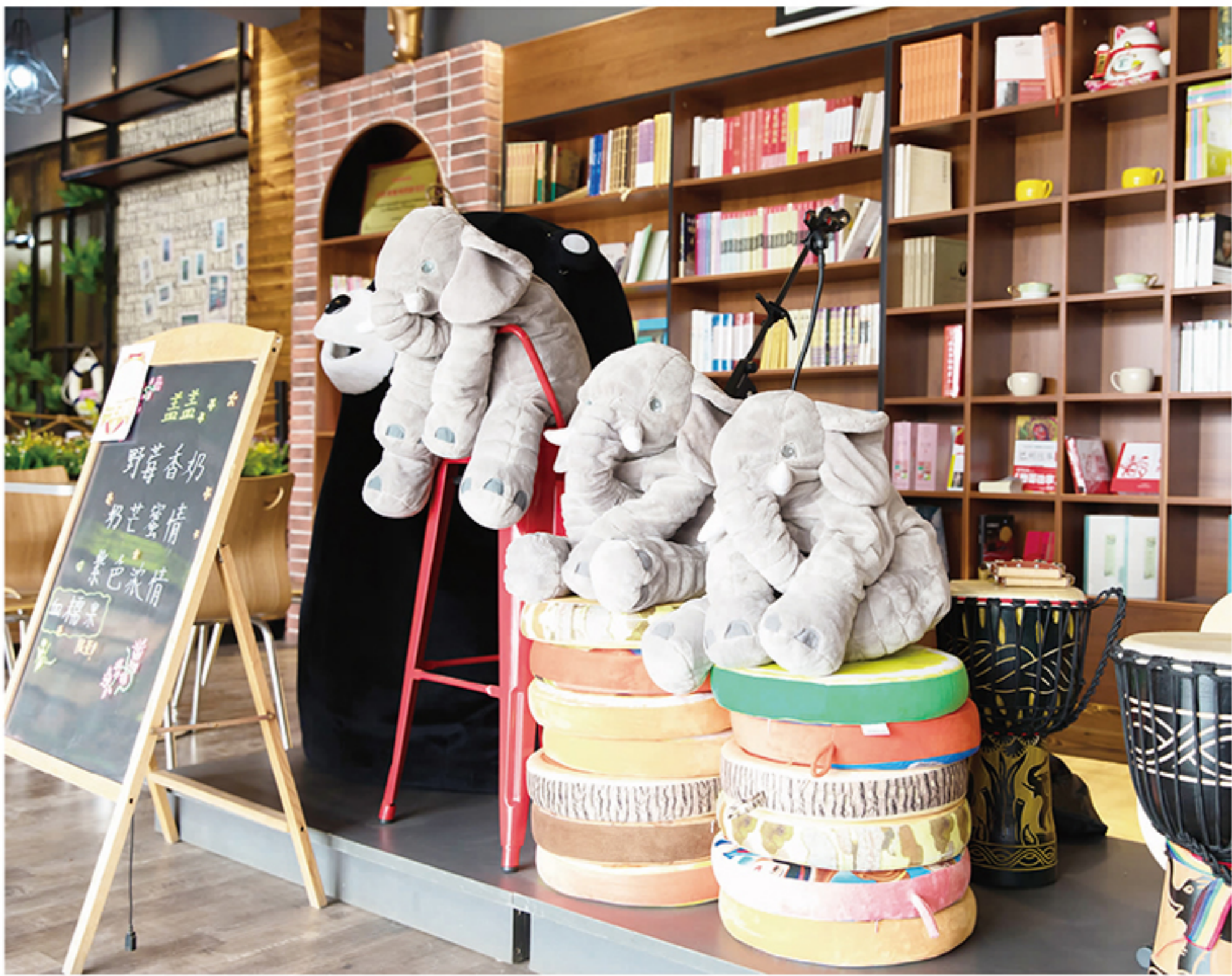
阳光明媚,春暖花开,一片生机勃勃,校园里变得热闹起来。在6号教学楼隐藏着一家书店,在这里可以寻得一份静谧,萌萌哒的装修风格有些俏皮。从书架上抽出一本自己喜欢的书,找个安静的地方坐下来,奶茶、咖啡的香气陪伴着书香,浸润着心脾。一行行文字映入眼帘,化成一串串音符,飞进了你的思绪。这里成了我们汲取养分,丰富思想的另一个小天地。