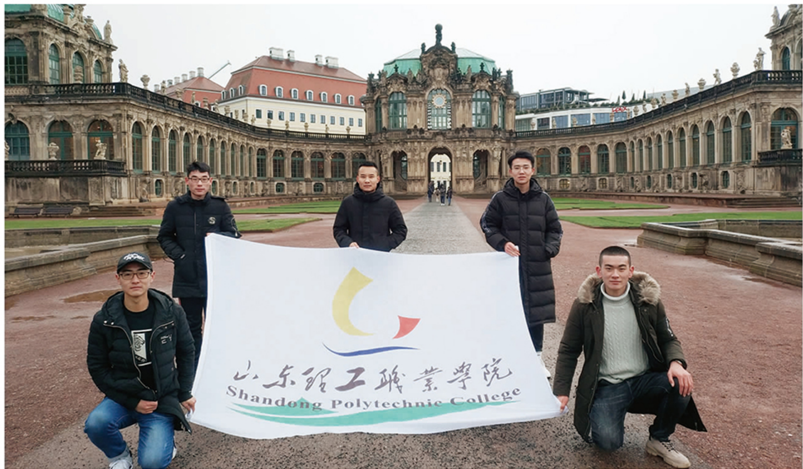
学生们在茨温格宫前留下足迹