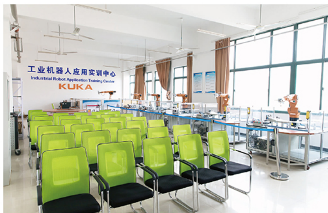
现代化的实训中心