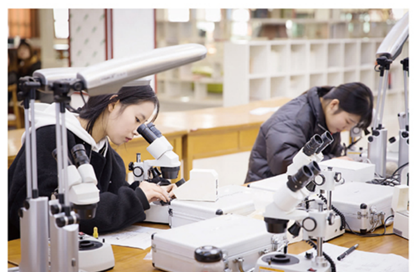
学子们用精密的仪器去探索知识