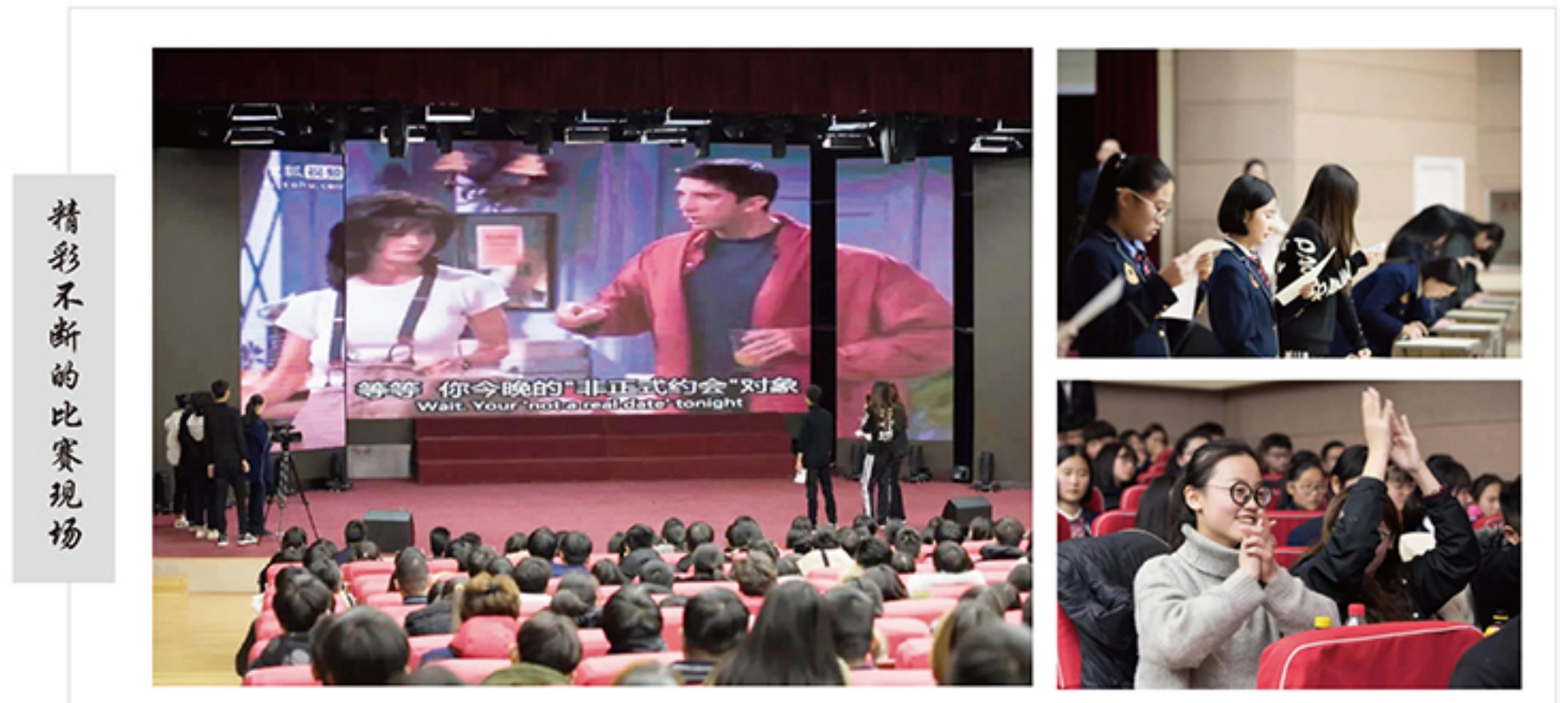
精彩不断的比赛现场

单词王大赛作为国际教育学院近年来品牌特色活动,旨在结合我院专业特色,展示我院学生的个人风采,培养学生学习英语的兴趣和积极性,提高学生的英语词汇量,做到以赛促学,以赛促教,营造良好的英语学习环境,培养学生良好的英语学习习惯,同时丰富学生的校园文化生活,让学生在比赛中体验英语学习的乐趣,从而向学院培养“中西融汇、内外兼修”的高素质国际化创新型人才的目标迈进。(文/田一琳)