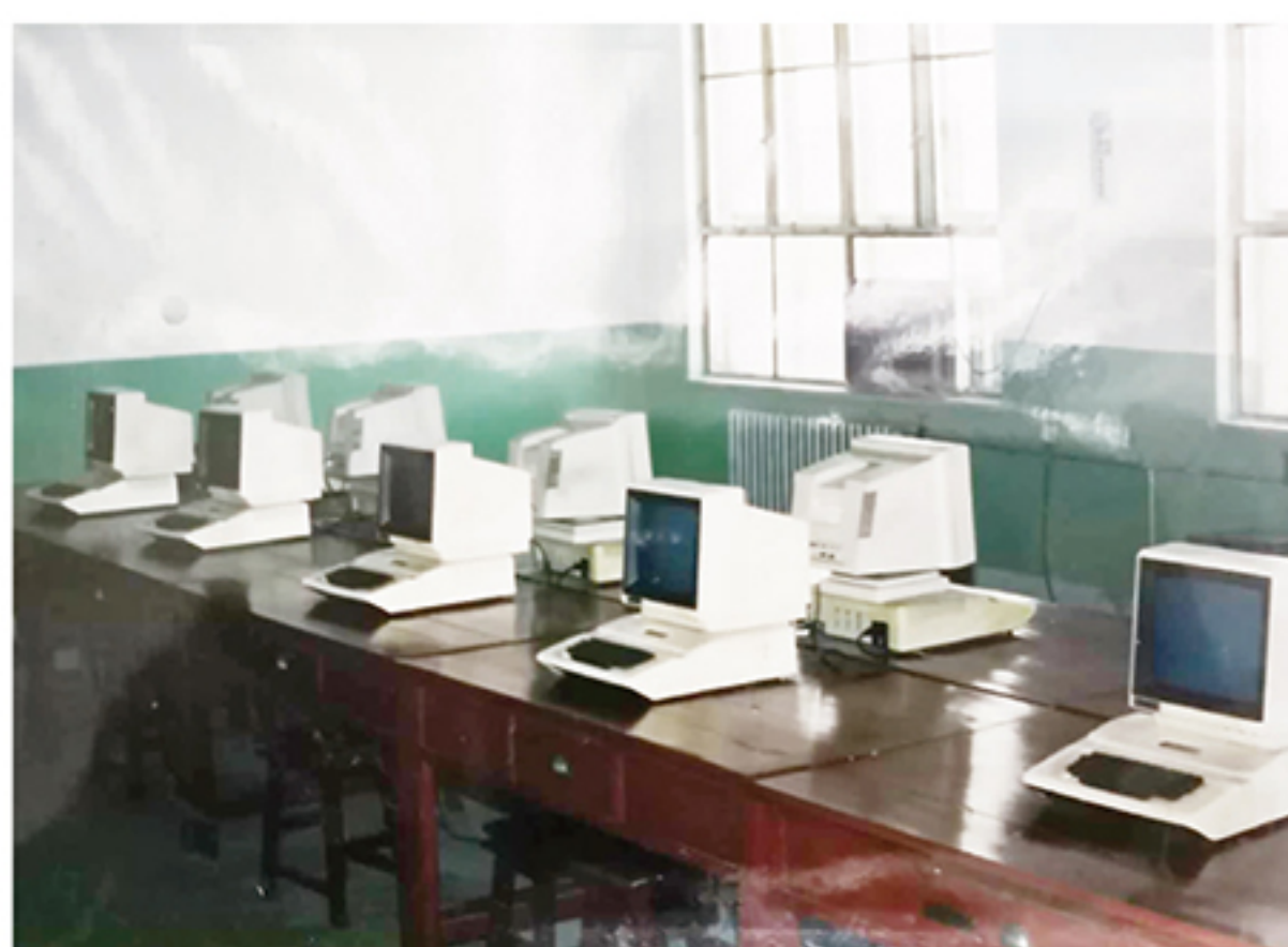
以前学习时使用的电脑