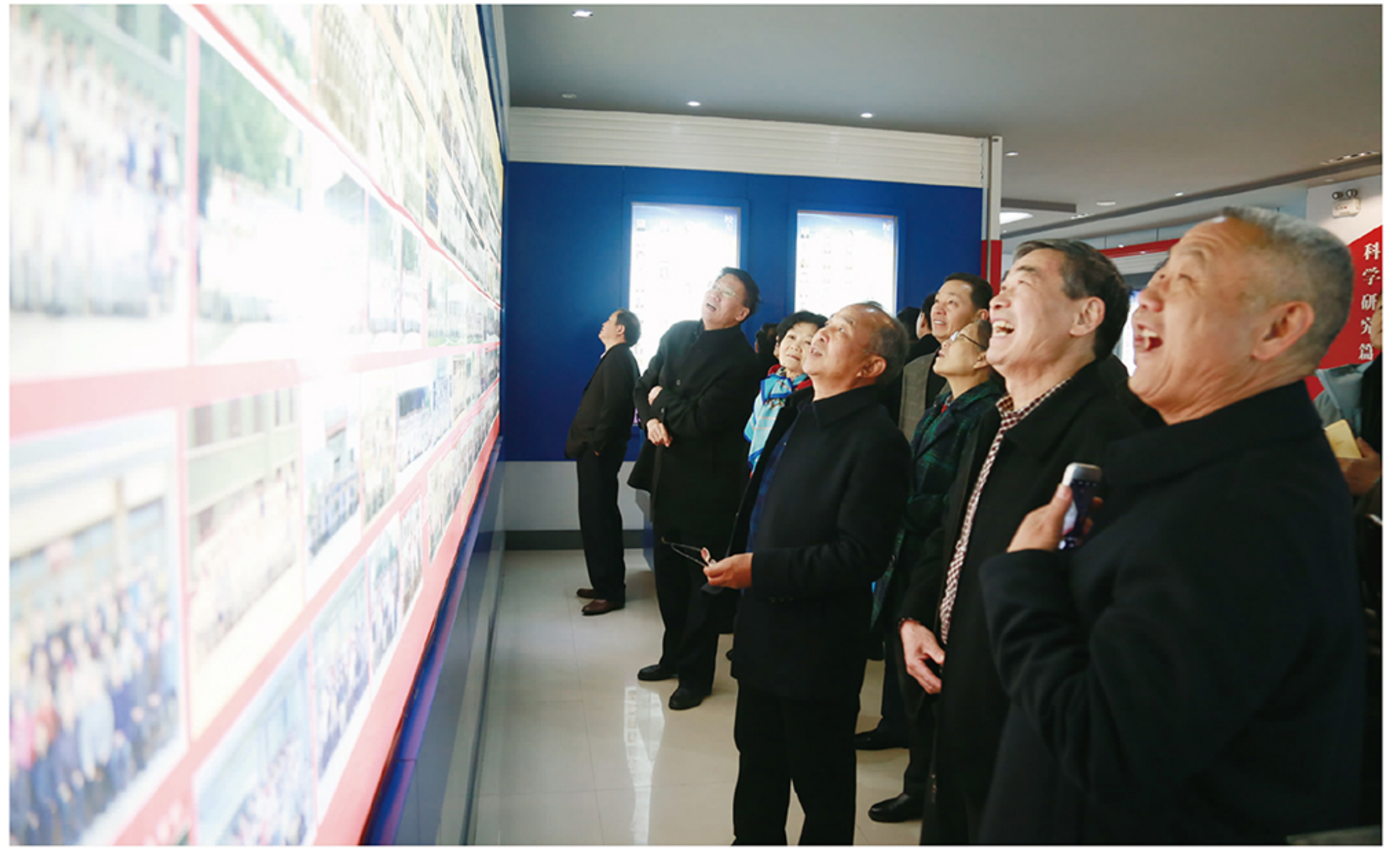
学院1977级校友重返母校庆祝入校40周年

2009年3月,省政府正式批准为我院改建为山东理工职业学院。翻开了学院发展史上崭新的一页!以三校区整体搬迁新校为标志,基本实现了多年来全校为之拼搏奋斗的“三校整合、迁建新校、改建职业学院、提升办学质量规模和效益”的任务目标,将一所崭新的高职院校建在了北湖湖畔!