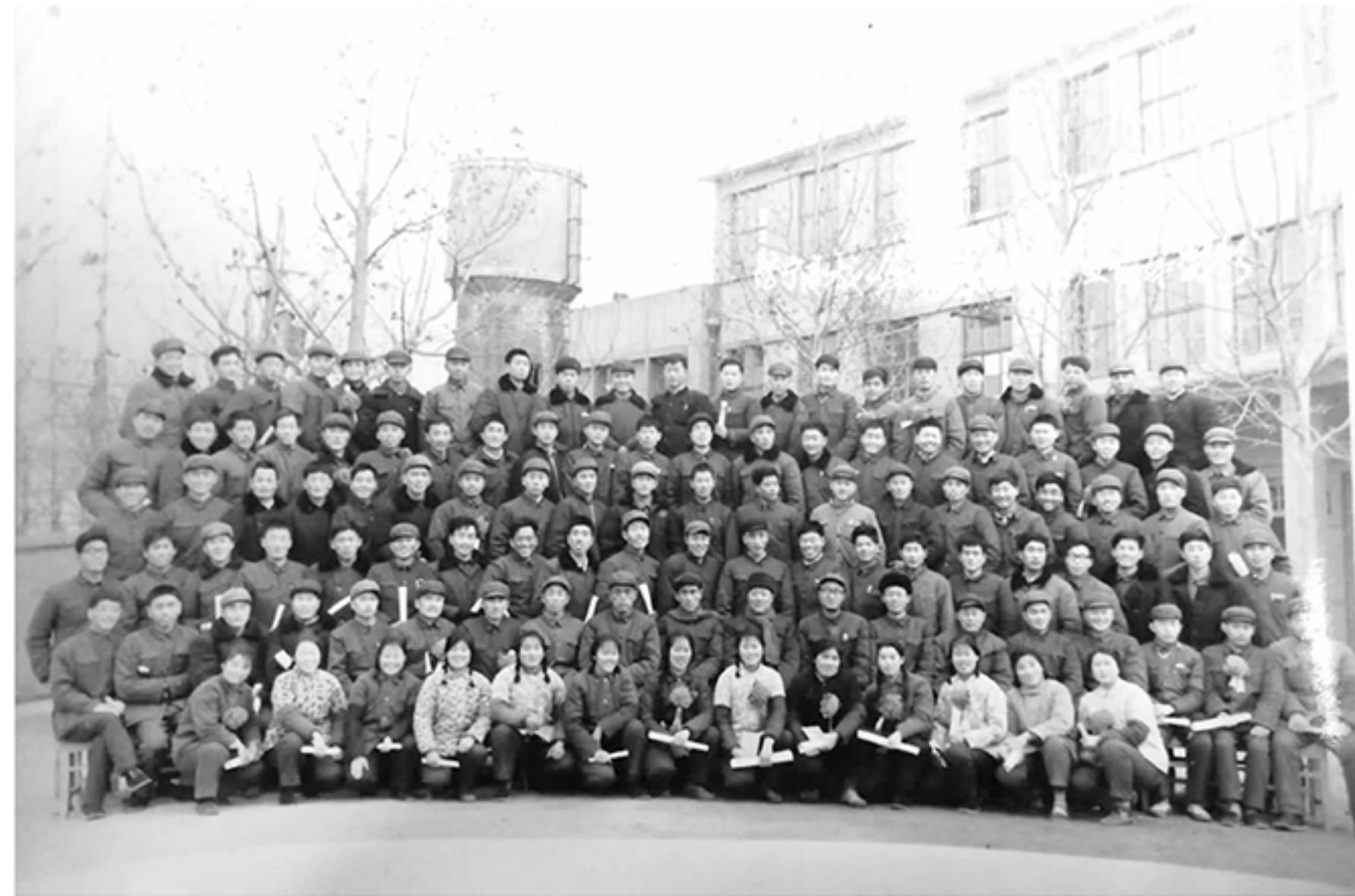
1978年的三好学生留影