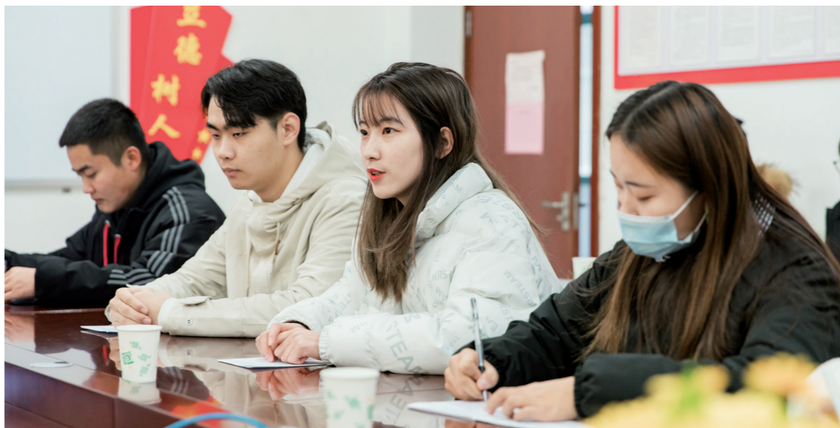
学生代表在座谈会上畅所欲言